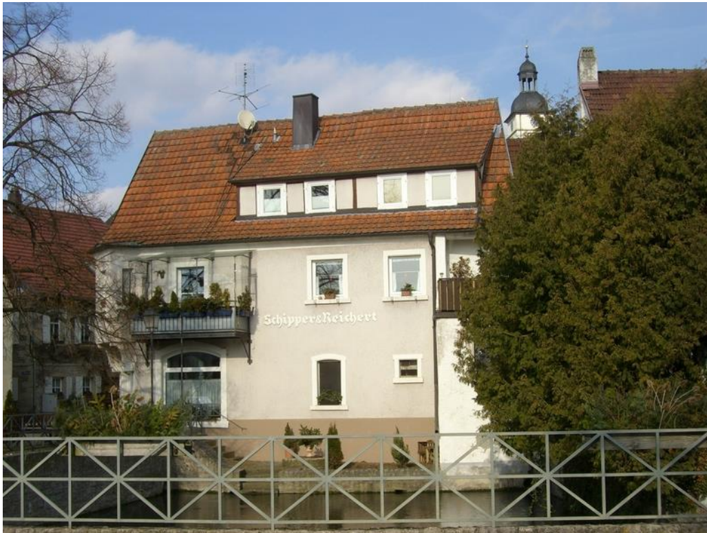
Rückseite des Gebäudes mit dem Schlegel im Vordergrund