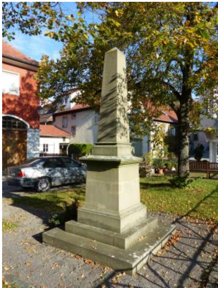
Das Kriegerdenkmal, das an den Sieg von 1870/71 gegen Frankreich erinnert