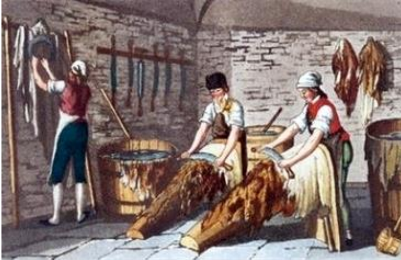
Gerber-Gemälde aus dem 19. Jahrhundert