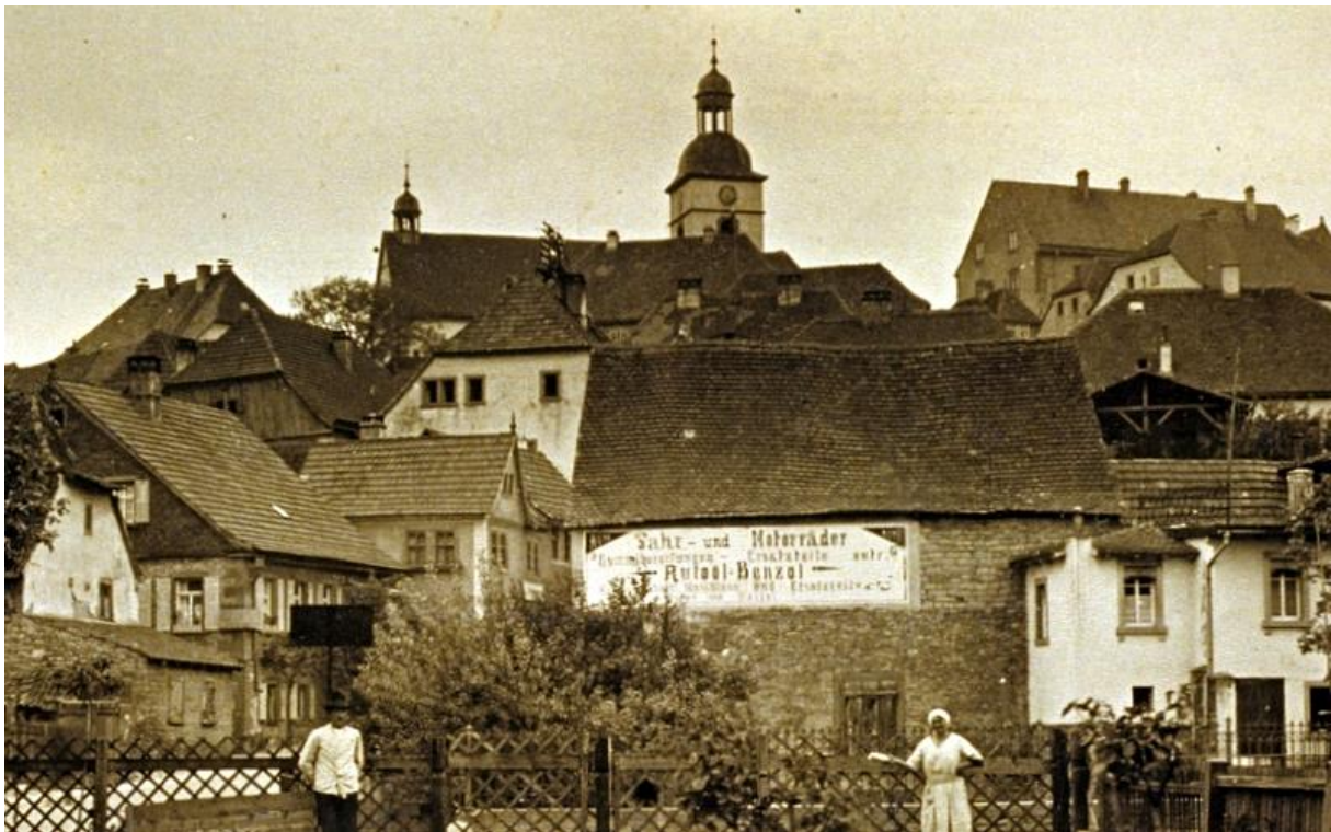
Diese Ansicht zeigt noch die alte Lager- und Autohalle um 1910

Nach dem Gebäude, Turm und Mauer abgerissen waren, wollte die Stadt hier ein Armenhaus errichten. Das bis dahin bestehende Armenhaus - heute Schulhof 10 - wurde von der Präparandenschule benötigt, die die steigende Schülerzahl unterbringen musste. Die Überlegung bezüglich eines Armenhauses wurde dann verworfen. Man baute stattdessen an dieser Stelle Anfang des zwanzigsten Jahrhunderts eine Halle, die als Garage und Holzlager genutzt wurde. Alte Bilder zeigen das Gebäude mit der Aufschrift ‚Fahr- und Motorräder - Gummibereifungen - Ersatzteile - Autoöl-Benzol‘. Der Pächter hiervon dürfte Ferdinand Schipper gewesen sein.