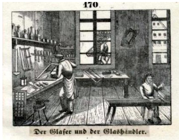
Nach dem Gerber bewohnte ein Glaser das schöne Haus

Margarethe (*15.5.1766 +22.4.1834), ledig